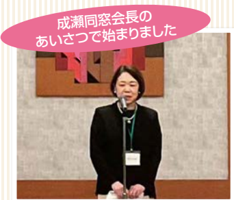
成瀬同窓会長のあいさつで始まりました

「還暦を楽しむ会」同窓会からご案内が届き..えっ 制服を着ていた私達が還暦?! 心待ちにしいざ会場でお互いお顔を見るなり『もしかして..〇〇ちゃん?』『きゃー久しぶり』そんな声が会場の至る所から聴こえてきました。校長先生から創立75周年を迎える貴重なお話もございました。 先生方もお変わりなく本当にお元気で過ごしていられている様をうかがいとても嬉しいです。聖霊で学んできた温かい人間関係をこれからもずっと続けていきたいとあらためて感じた瞬間でした。素敵な時間を過ごす事が出来感謝の気持ちでいっぱいです。 この会に関わってくださった全ての皆様にご心よりお礼申し上げます。